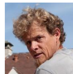
Sébastien – Lot - Calcaire