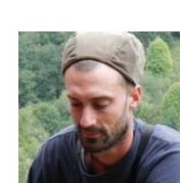
Martin – Saône-et-Loire - Calcaire