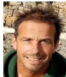
Yoann – Aveyron - Calcaire