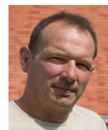
Vincent – Lot - Calcaire