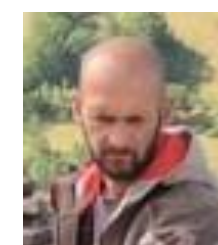
Nicolas – Aveyron – Calcaire - Schiste