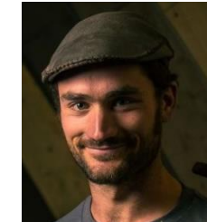
Pierre – Lozère - Schiste