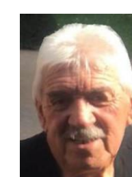
Gérard – Aveyron - Calcaire