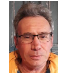
Joseph – Haute-Loire - phonolite