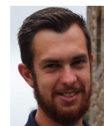
Sylvain – Aveyron Schiste - Calcaire